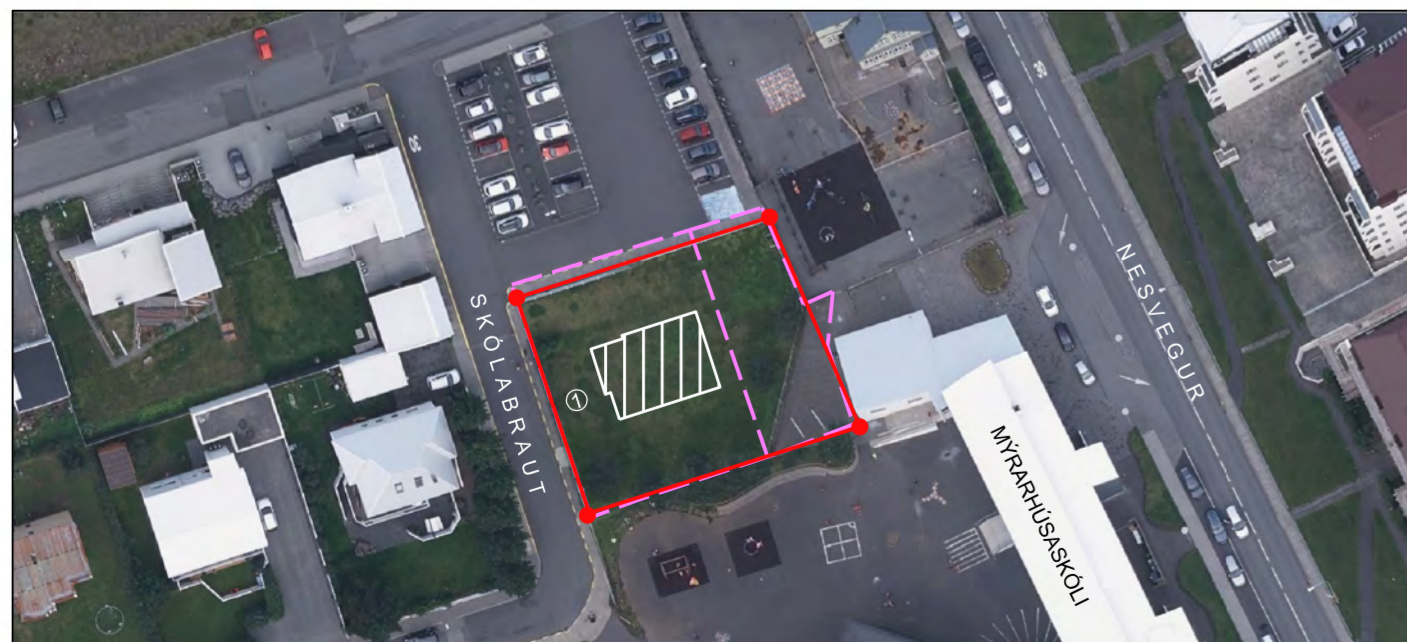
SKÝRINGARMYND NÚVERANDI ÁSTAND