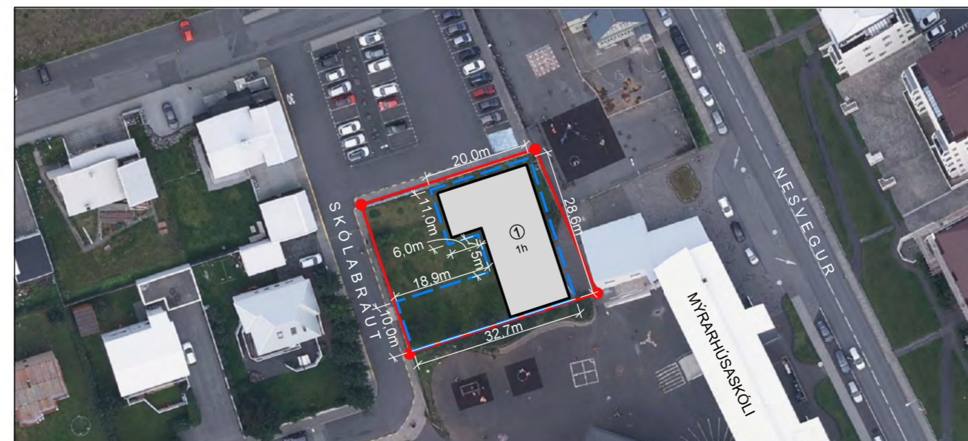
SKÝRINGARMYND TILLAGA AÐ BREYTINGUM