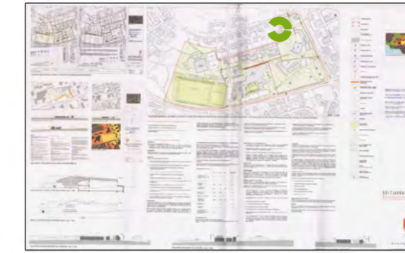
Suðurströnd - Hrólfsskálamelur Gildandi deiliskipulag