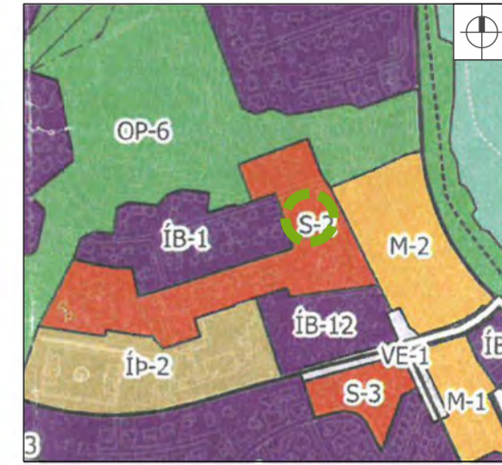
HLUTI AF ADALSKIPULAGI SELTJARNARNESS 2015-2033