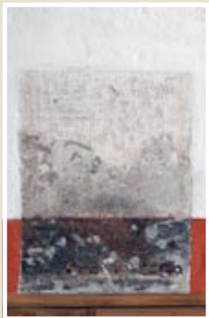
Upprunalegar litalleifar í stofu á fyrstu hæð.

Á bita í lofti, nálægt útvegg, má sjá sýnishorn af litalögum. Hefilstrik neðan á bitabrúnum eru skreytt með rauðum lit. Niðri við gólf á milli- og gaflvegg getur að líta leifar af rauðum sökkullit og ljósgráum veggjarlit. Hæðarmunur á sökkullit skýrist af því að milliveggurinn hefur sigið. Á vesturvegg getur að líta ummerki um vindofn sem hitaði upp