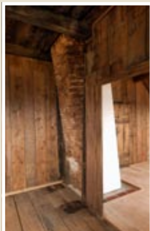
Endurgerðir og viðgerðir í norðurherbergjum á annarri hæð.