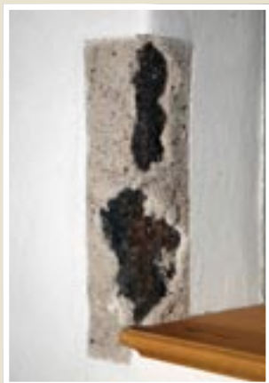
Íslenskt grágrýti í dönsku kalki sýnilegt í gluggamúr á annarri hæð.