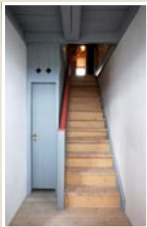
Endurgerður stigi í austur-inngangi.

Endursmið stigans er frá 2007. Teikningar að stiganum voru gerðar á grundvelli byggingarrannsókna og með hliðsjón af stiga í Viðeyjarkirkju frá 1772. Í upphafi var hurð með tilheyrandi umbúnaði fyrir stigauppgöngunni en ákveðið var að sleppa henni í hagræðingarskyni fyrir nýja notkun hússins.