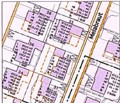
NÚVERANDI SKIPULAG MKV.: 1:1000