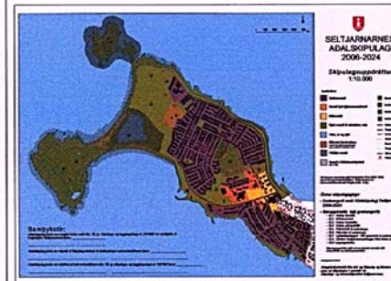
Aðalskipulag Seltjarnarness samþykkt af bæjarstjórn 22.febrúar 2006 og af umhverfisráðherra 5.mai 2006