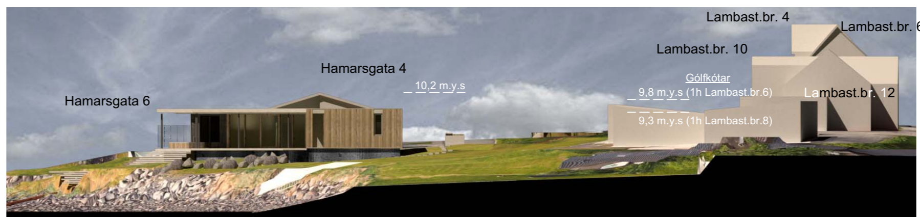
Ásýnd suðausturhlíð - skýringarmynd