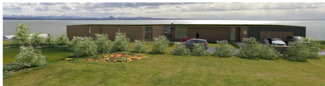
Útsýni af fyrstu hæð Lambastaðabraut nr.6 - skýringarmynd