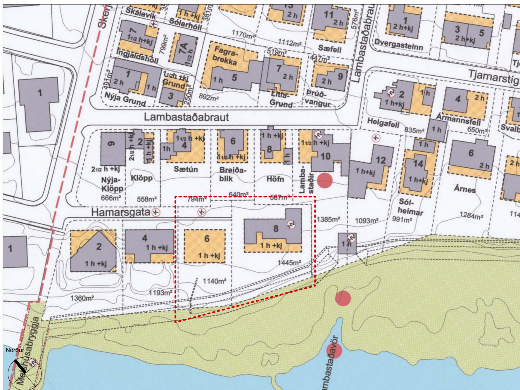
Gildandi deiliskipulag Lambastaðahverfis, samþykkt í bæjarstjórn 12.júní 2013 og birt í B-deild Stjórnartíðinda 1. ág.2013 Mkv. 1:1000