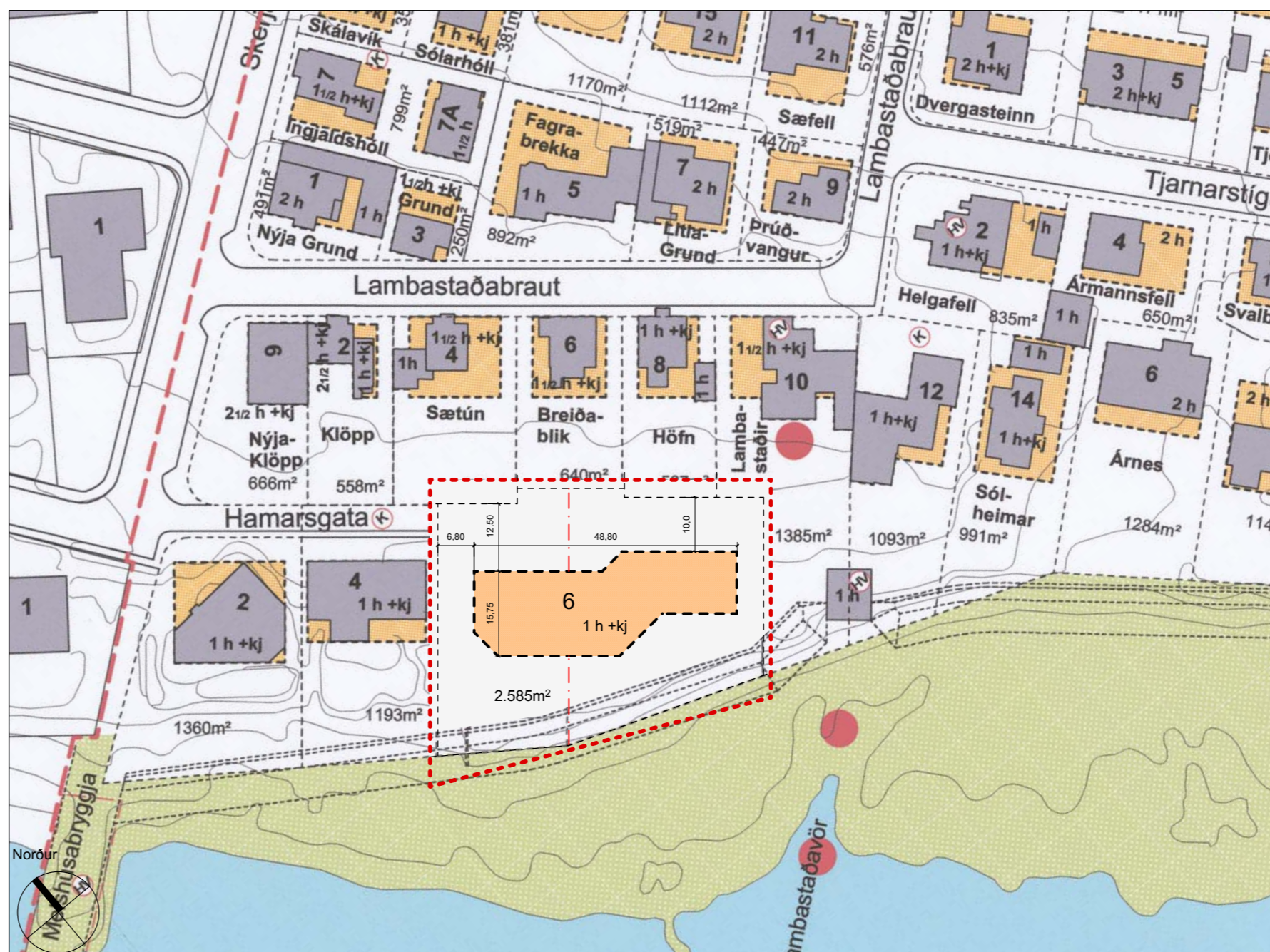
Tillaga að breyttu deiliskipulagi Mkv. 1:1000