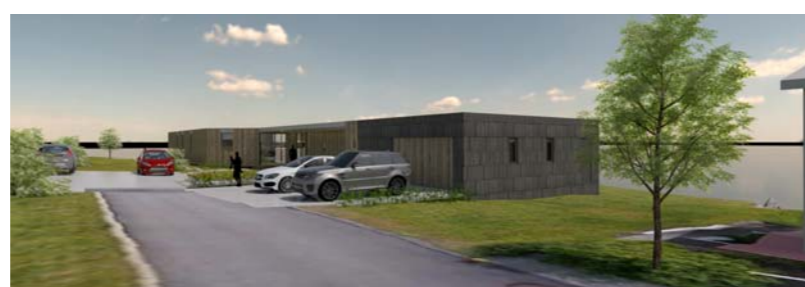
Aðkoma um Hamarsgötu-skýringarmynd